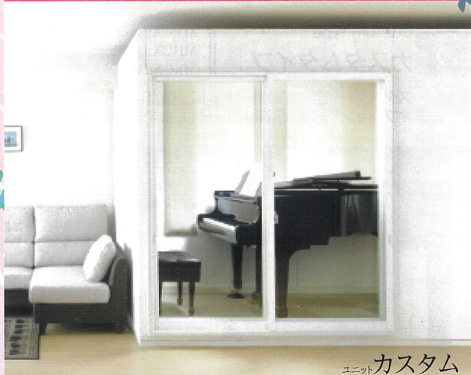
ユニットカスタム