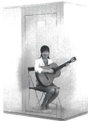
1.2畳サイズ、遮音性能:Dr-30 LVSX13-13 本体標準価格(税込) ¥638,000 (税抜) ¥580,000