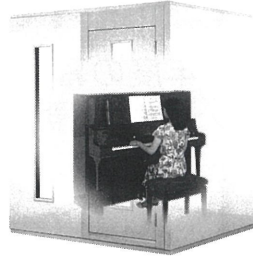
2.0畳サイズ、遮音性能:Dr-35 MHSX18-18 本体標準価格(税込) ¥1,221,000 (税抜) ¥1,110,000 ※FIX窓はオプション