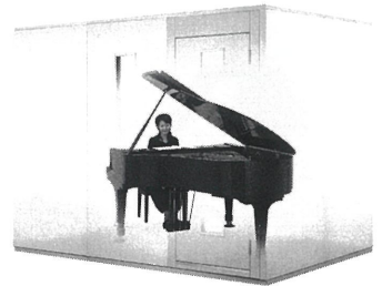
3.0畳サイズ、遮音性能:Dr-35 MHSX18-26 本体標準価格(税込) ¥1,452,000 (税抜) ¥1,320,000 ※FIX窓はオプション