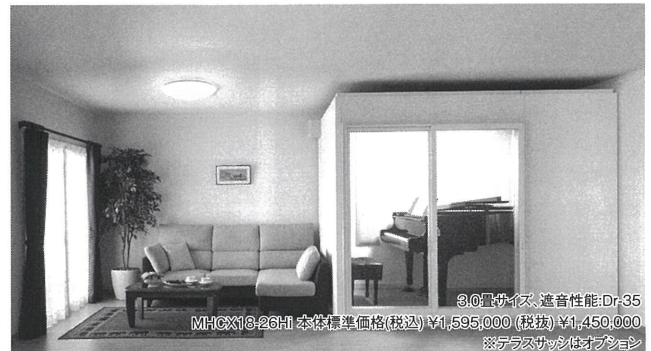
3.0畳サイズ、遮音性能:Dr-35 MHCX18-26H 本体標準価格(税込) ¥1,595,000 (税抜) ¥1,450,000 ※デラックス仕様はオプション