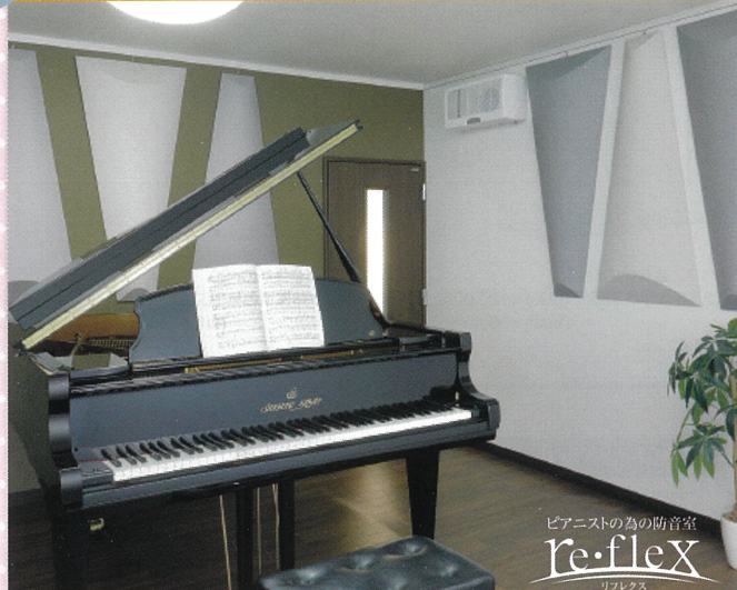
ピアニストのための防音室 re: flex リフレックス