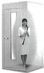
0.8畳サイズ、遮音性能:Dr-30 LVSX09-13 本体標準価格(税込) ¥550,000 (税抜) ¥500,000