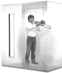
1.5畳サイズ、遮音性能:Dr-30 LVSX13-18 本体標準価格(税込) ¥726,000 (税抜) ¥660,000 ※FIX窓はオプション